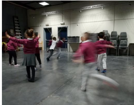
« L'Âme est partout parce que c'est nous » (Témoignage d'un enfant)