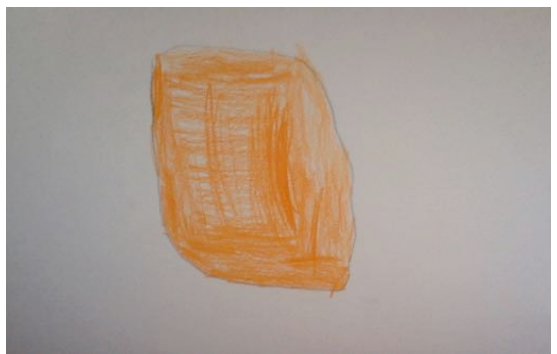
Représentations de l'âme vu par des enfants durant les ateliers